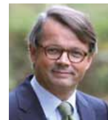
Drs. R.J.X. Wanders Bestuurder Stichting