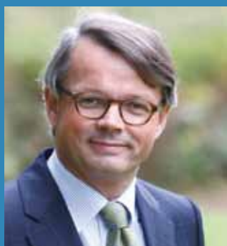
Drs. R.J.X. Wanders Bestuurder Stichting