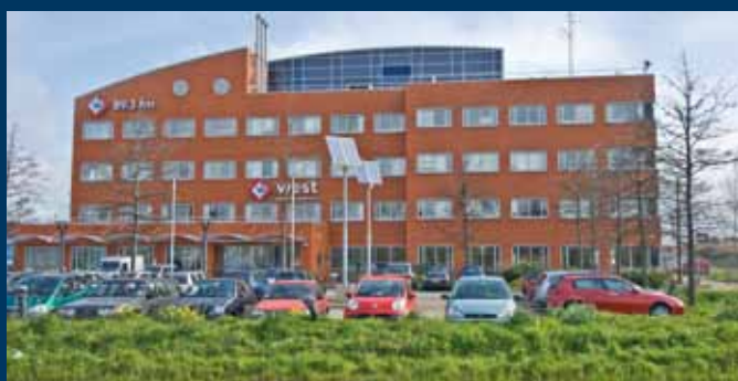
Den Haag, Laan van 's Gravenmade 2

Het is wel van belang dat uw erfgenamen binnen een jaar na overlijden beslissen op welke wijze het kapitaal wordt aangewend. Hierbij gelden de volgende voorwaarden: