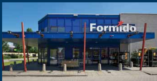
Zwolle, Charles Storkstraat 3