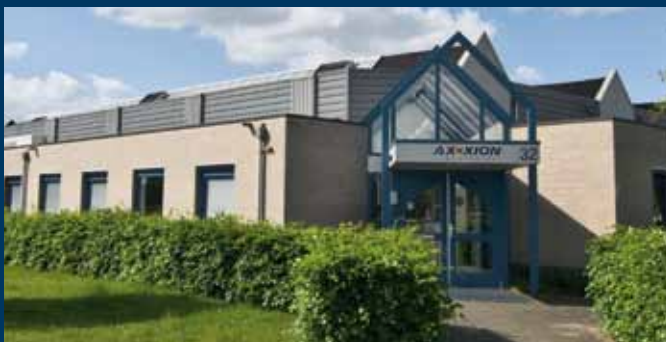
Zwolle, Stephensonstraat 32

*sectorale verdeling SynVest RealEstate Fund N.V. per 1-4-2011