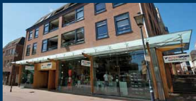
Arnhem, Jansplein 20-22