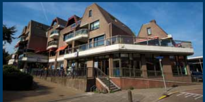
Hillegom, Houttuin 1 – 12