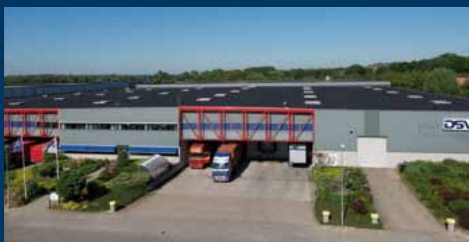
's-Heerenberg, De Immenhorst 7

*De uitkeringen starten uiterlijk in het jaar waarin men 70 wordt