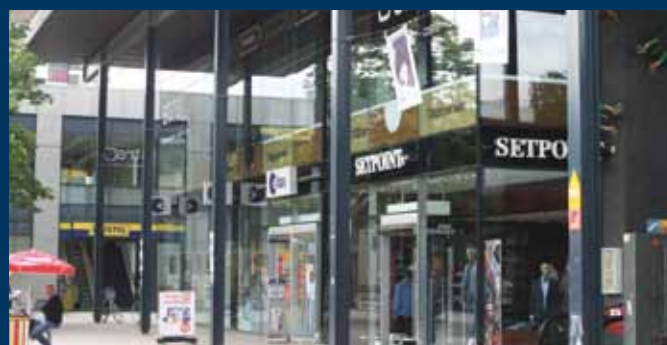
Emmen, winkelcentrum de Weijert

‘EEN GOEDE BELEGGING VOOR UW GOUDEN HANDDRUK’